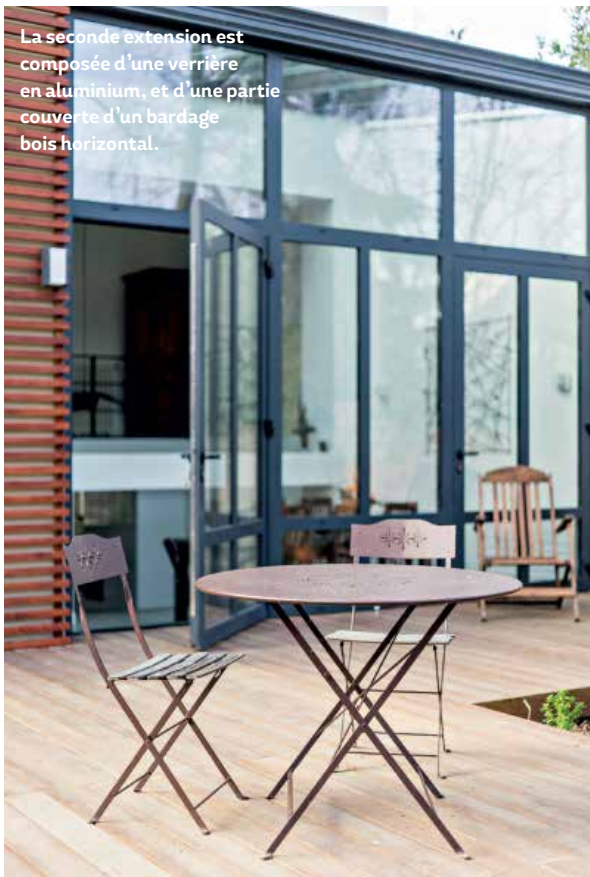
La seconde extension est composée d'une verrière en aluminium, et d'une partie couverte d'un bardage bois horizontal.